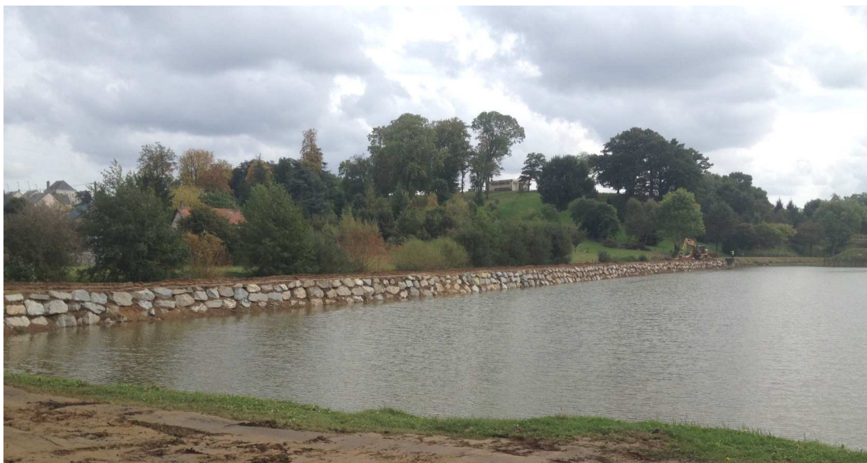
Digue du plan d'eau de VAIGES après travaux